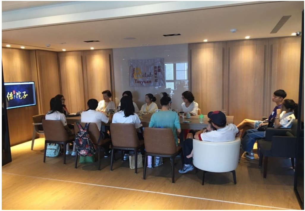
大家認真聆聽低碳健康宅居家不斷電的重要性