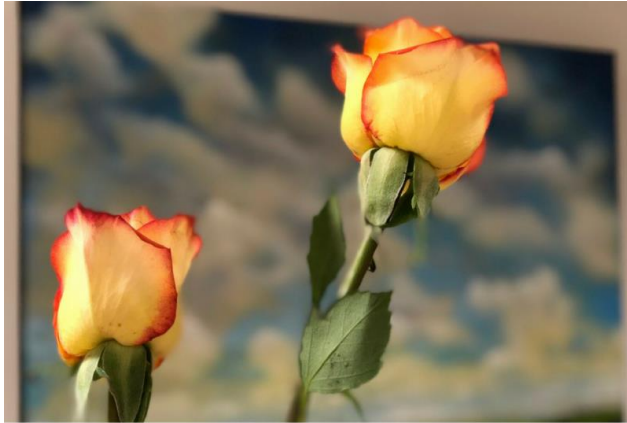
The Zonta Club of Woodstock sold yellow roses on 8 March to local businesses, including Woodstock Hospital, in recognition of Zonta Rose Day and International Women's Day.